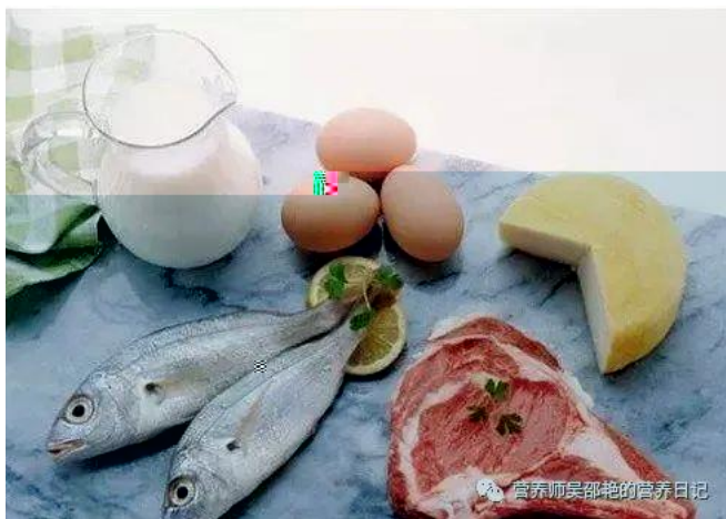
蛋白质帮助我们控制体重